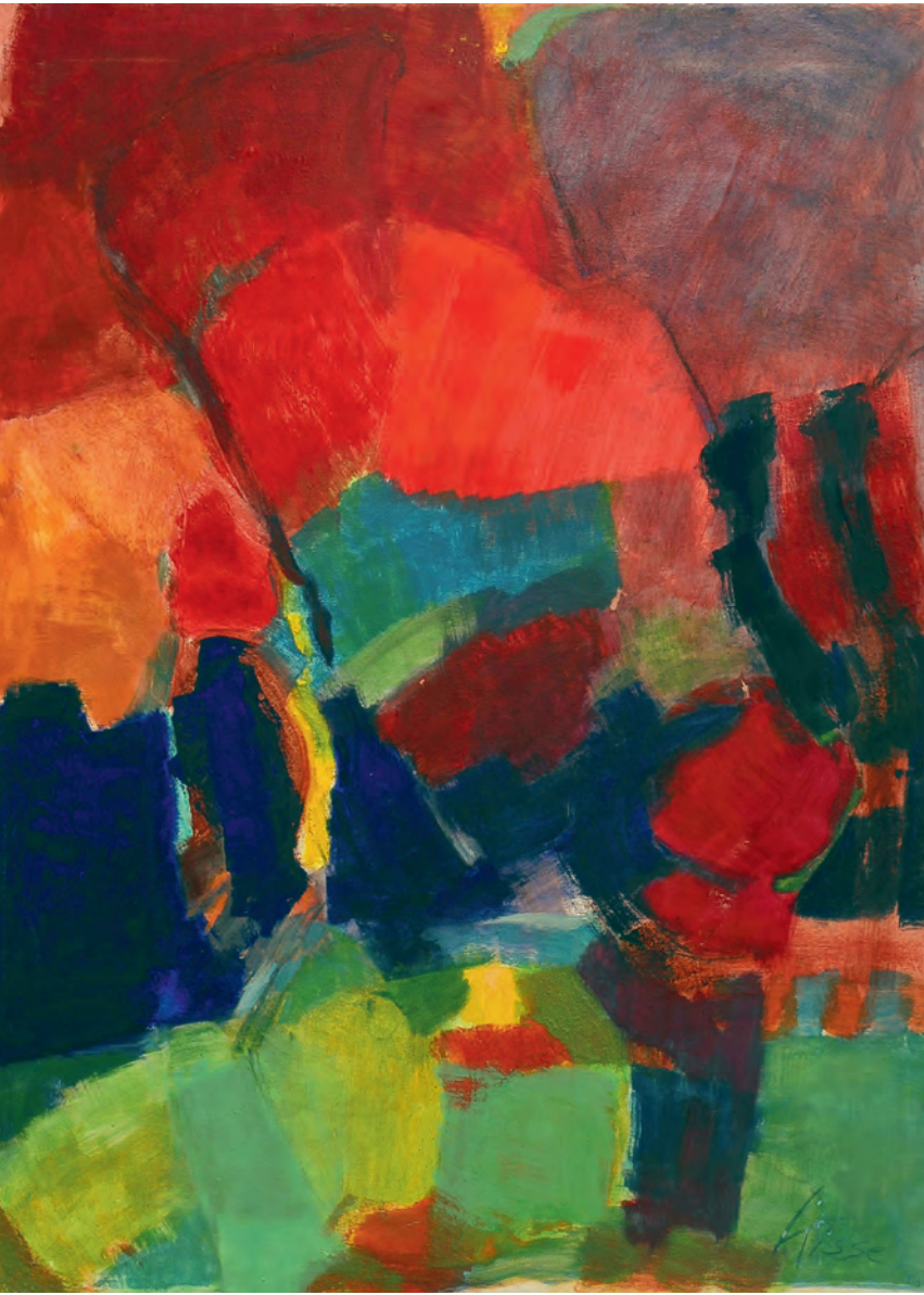
„Der Sommer war sehr groß“ Öl und Eitempera auf Leinwand, 80 x 60 cm